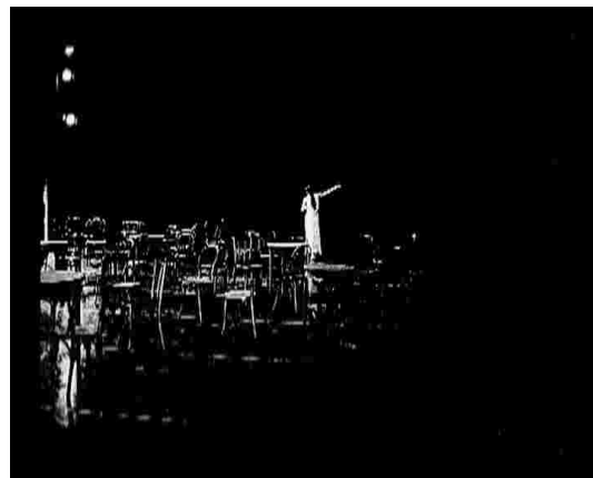
Café Müller – Pina Bausch