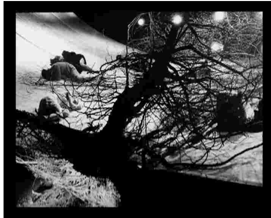
Komm tanz mit mir-Ensemble,Foto:Ulli Weiss©

Von Kindheit an war der Tanz extrem wichtig für mich. Im Tanz konnte ich alle Gefühle ausdrücken, die ich mit Worten nicht sagen konnte. So viele verschiedene Stimmungen, so viele Tönungen und Färbungen. Und darauf kommt es an: den Reichtum zu erhalten, ihn nicht einengen, die verschiedenen Stimmungen sichtbar und fühlbar machen. Unsere, unser aller Gefühle sind sehr genau.